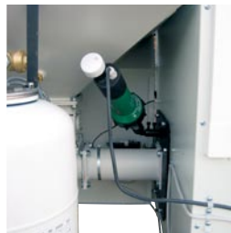
Automatisk tænding (ekstraudstyr).