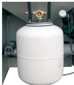
Tryktank til sprinkleranlæg, efter BTV32.