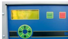
Fuldtmodulerende iltstyring, forprogrammeret til tre brændselstyper og ekstraudstyr