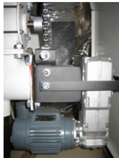
Schweizisk lav-friktions tandhjulsgeard med lavt energiforbrug.

9: Brænderhoved i sænksmedet støberjern.