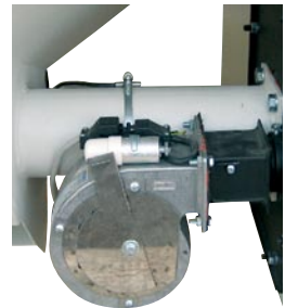
Elektronisk reguleret blæser i støbt hus med kuglelejer.