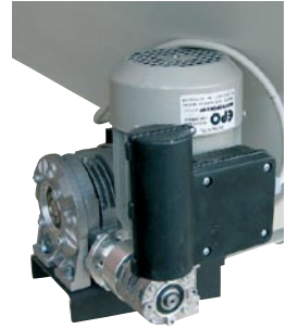
220V gearmotor med ekstra startmoment og termosikring.