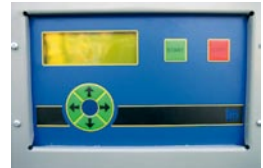
Fuldtmodulerende iltstyring, forprogrammeret til tre brændselstyper, og ekstraudstyr