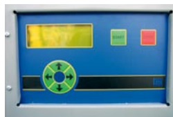
Fuldtmodulerende iltstyring, forprogrammeret til tre brændselstyper og ekstraudstyr