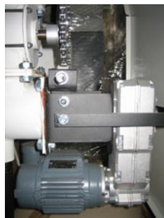
Schweizisk lav-friktions tandhjulsgear med lavt energiforbrug

9: Brænderhovede i sænksmedet støbejern.