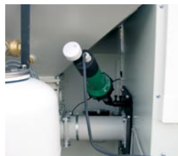
Automatisk tænding (ekstraudstyr).