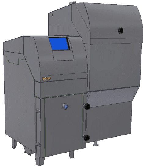
C 15 Højre set forfra.

Overskuelig module- rende styring. Stilrent design med fuld af- skærmning, kontrol af forbrænding gennem skueglas, standard monteret med den nye patenterede retort. Fås med magasin på højre eller venstre side.