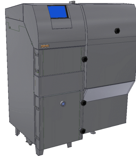
C 25 Højre set forfra.

Overskuelig module- rende styring. Stilrent design med fuld af- skærmning, kontrol af forbrænding gennem skueglas, standard monteret med den nye patenterede retort. Fås med magasin på højre eller venstre side. To låger til brændkammer